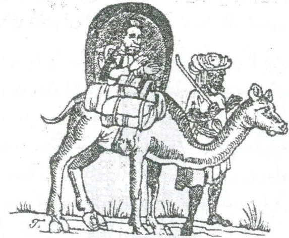
رسم رقم (٩) أحد التجار فوق جملة، يقوده تابع

(١) يؤخذ على فيلكس فابري قوله إنه "لا زال يوجد بالقاهرة أكثر من اثنين وعشرين ألف من المسيحيين الشرقيين الروم" أي روم أرثوذكس على المذهب الملكاني وليس على المذهب المونوفيزي الذي يعتقه أقباط مصر. علما بأن الروم الأرثوذكس كانوا يشكلون قلة آنذاك. إذ جاء في مصدره: "On trouve encore plus de Vingt-Deux Mille Chrétiens Orientaux Grecs". انظر: voyage en Egypte, t.III, p.567. كما لم يشير على الإطلاق إلى أقباط مصر الذين يشكلون الغالبية العظمى من سكان مصر آنذاك.=